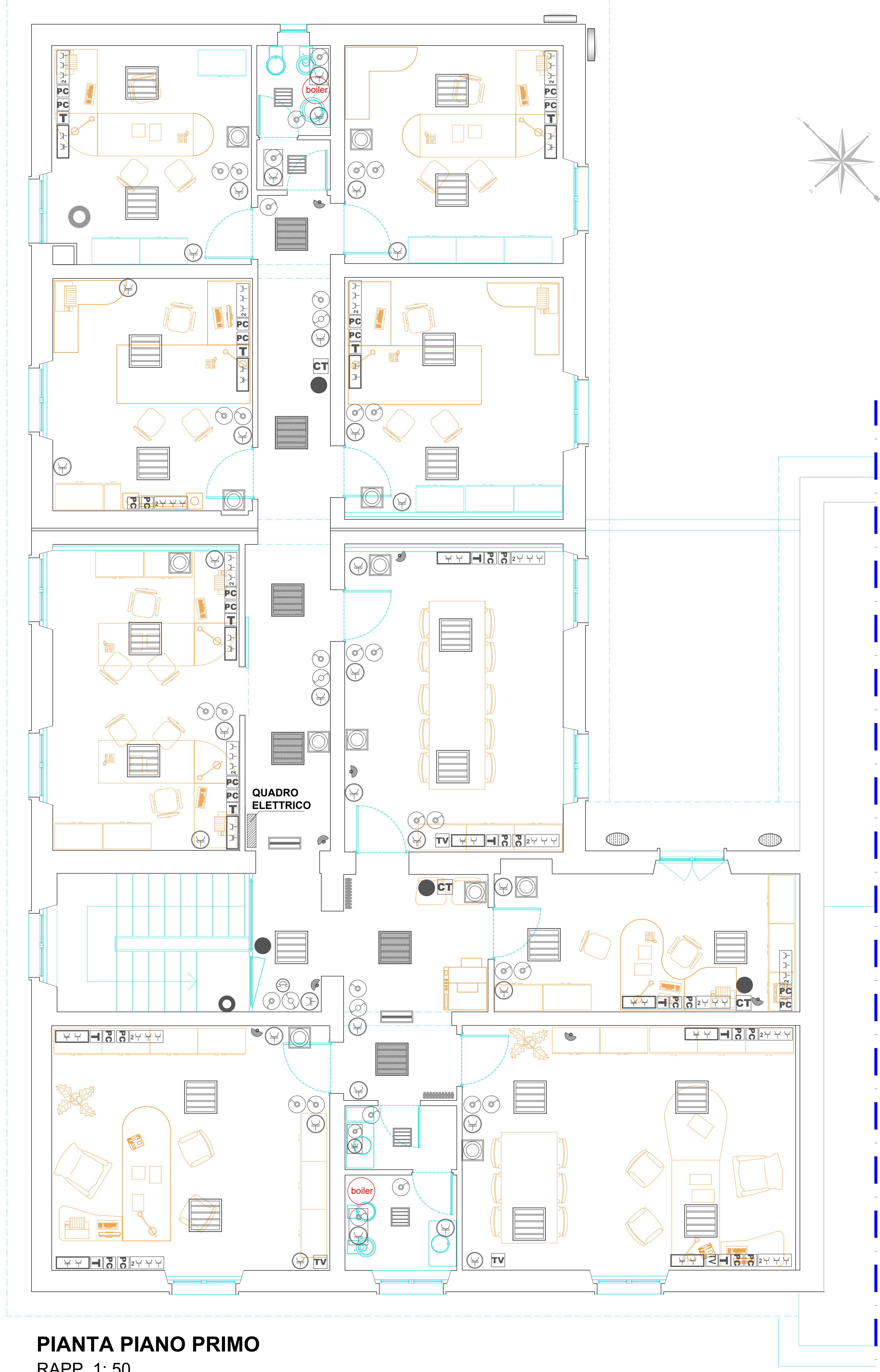
PIANTA PIANO PRIMO RAPP. 1: 50